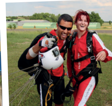
Pure Freude ■ tagelang