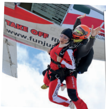
Flug/Ausstieg ■ 20 min