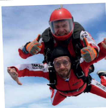
Freifall ■ ca. 25 oder 50 s