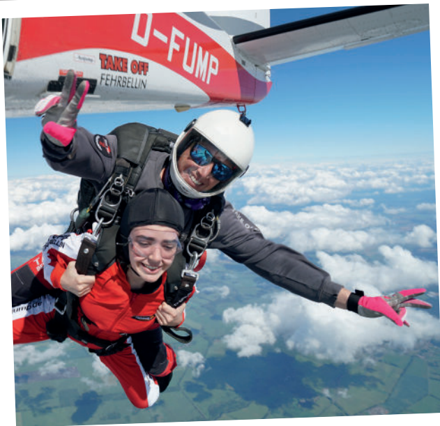
Mein erster Sprung