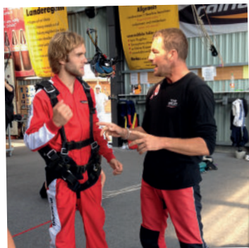
Persönliche Einweisung ■ 30 min