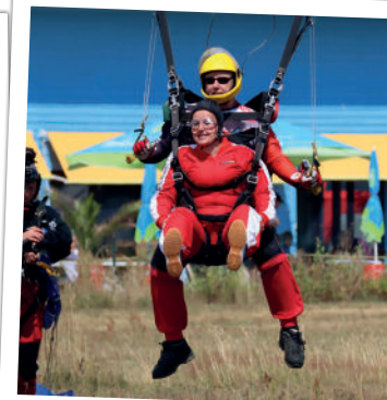
Landeanflug ■ 30-60 s