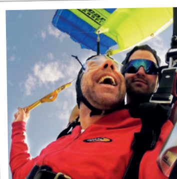
Schirmflug ■ 5-7 min